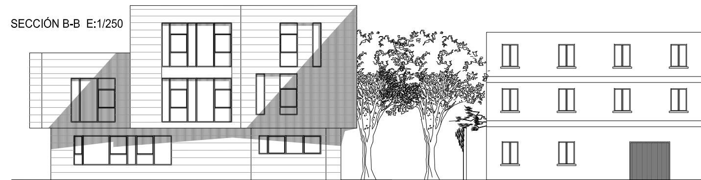
SECCIÓN B-B E:1/250

ARQUITECTO, PATRICIA PARADA PIÑEIRO . Coleg. COAG 2872.